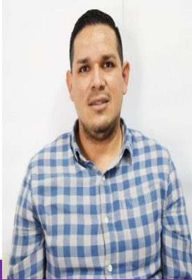
Dirección de Construcción EFREN RUELAS PALOMERIA NIVEL 15